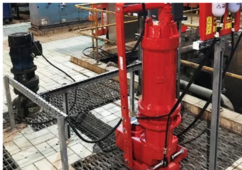
Abwasserzerkleinerer Vogelsang XRipper XRC-SIK

Scottish Water Services (Grampian) installierte vor einigen Jahren Doppelwellenzerkleinerer im Zulauf der Kläranlage von Nigg, um die nachgeschalteten Pumpenanlagen zu schützen und die Effizienz der Siebung zu verbessern. Zwar war man mit der allgemeinen Funktion der Zerkleinerungsmaschinen zufrieden, doch die laufenden Betriebskosten gaben zunehmend Anlass zur Sorge. Diese Zerkleinerungsmaschinen waren nicht einfach zu warten und konnten nicht von den eigenen Technikern gewartet werden, was zu häufigen Überholungen außerhalb des Werks führte und teure und zeitaufwändige Reparaturen verursachte.