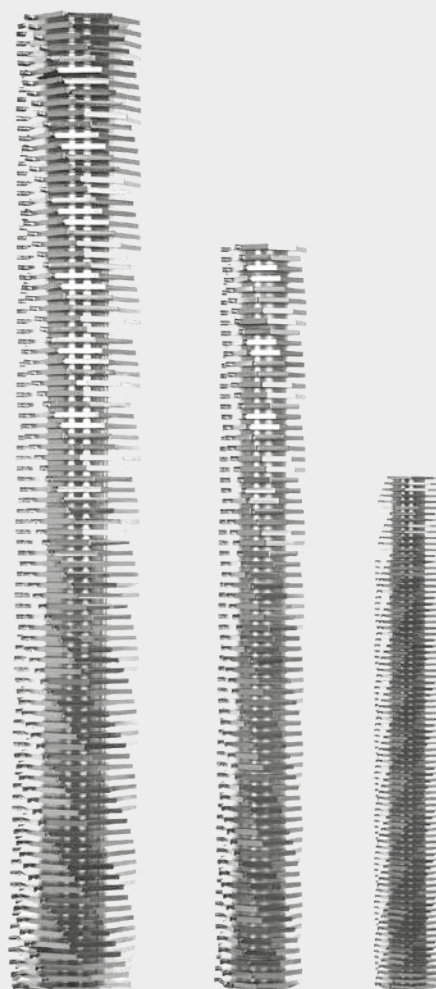
I rotori Ripper monolitici sono estremamente robusti e particolarmente facili da sostituire

Un altro vantaggio di questo design unico è la facilità di sostituzione dei pezzi! Invece di sostituire molti singoli dischi e distanziali inseriti uno ad uno sugli alberi portanti, è necessario cambiare solo i rotori Ripper in un unico blocco. Grazie al design simmetrico, possono anche essere ruotati di 180 gradi. Inoltre, nei modelli XRP, XRC e XRG, l'intera unità funzionale - composta da motore, riduttore, rotori Ripper e controcuscinetti - può essere semplicemente estratta dall'alloggiamento in un unico pezzo. L'alloggiamento rimane al suo posto, mentre tutte le parti importanti per l'assistenza e la manutenzione sono facilmente accessibili.